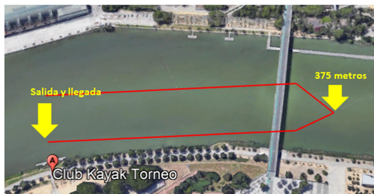
Croquis del Recorrido de los Alevines Canoa, Benjamines y Prebenjamines