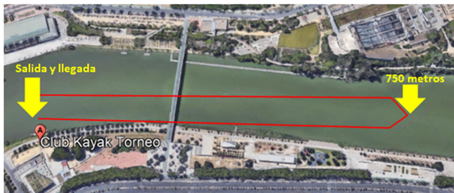
Croquis del Recorrido de los Alevines Kayak